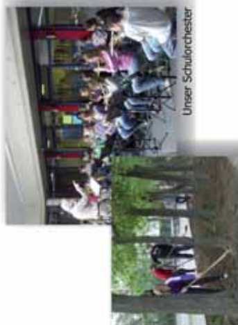
Garten AG bei der Arbeit